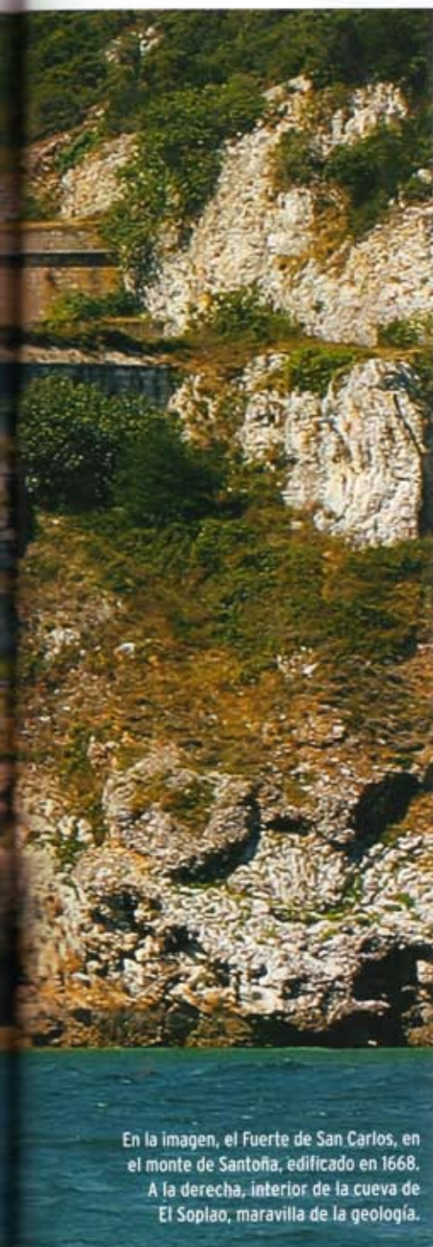
En la imagen, el Fuerte de San Carlos, en el monte de Santoña, edificado en 1668. A la derecha, interior de la cueva de El Soplo, maravilla de la geología.