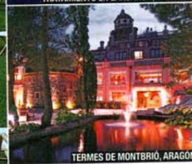
TERMES DE MONTBRIÓ, ARAGÓN