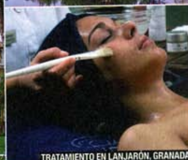
TRATAMIENTO EN LANJARÓN, GRANADA