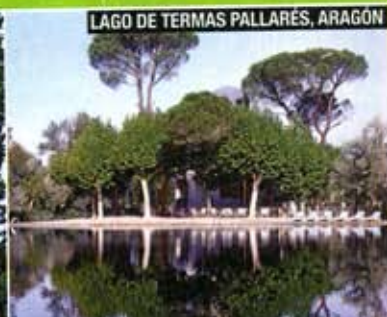
LAGO DE TERMAS PALLARÉS, ARAGÓN