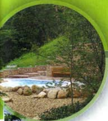
PUENTE VIESGO, CANTABRIA