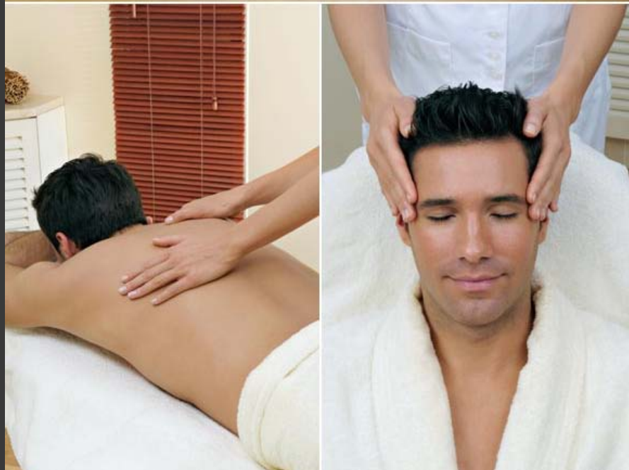
Balneario de Puente Viesgo.