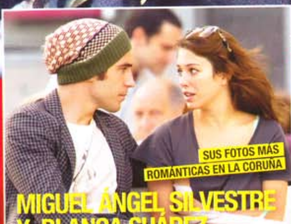
SUS FOTOS MÁS ROMÁNTICAS EN LA CORUÑA